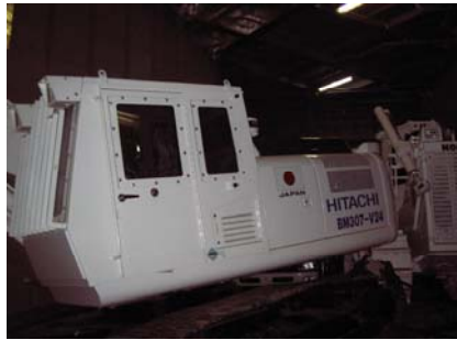
ROROハッチより積込後の地雷処理機本体(2)