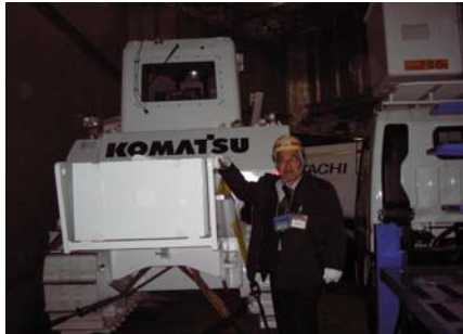
ROROハッチより積込後の地雷処理機本体(1)

オーシャングローバルフレイトでは2008年2月 カンボジア向けにメディアでも取上げられた最新地雷処理機3台の輸送を手掛けました。在来船のスペースを使っての輸送手配となり横浜/大阪港より積込となりました。今後継続的に世界各地への輸送を手掛ける予定です。