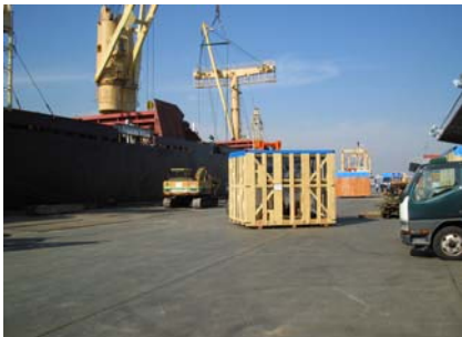
本体パーツ積込前(2)