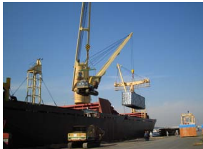
パーツ本船積込み状況(1)