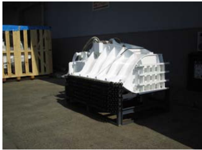
本体パーツ積込前(1)