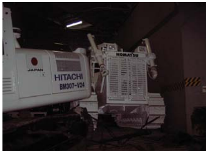
ROROハッチより積込後の地雷処理機本体(3)