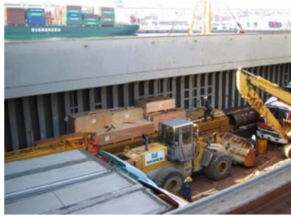
パーツ、インハッチへ積込み後